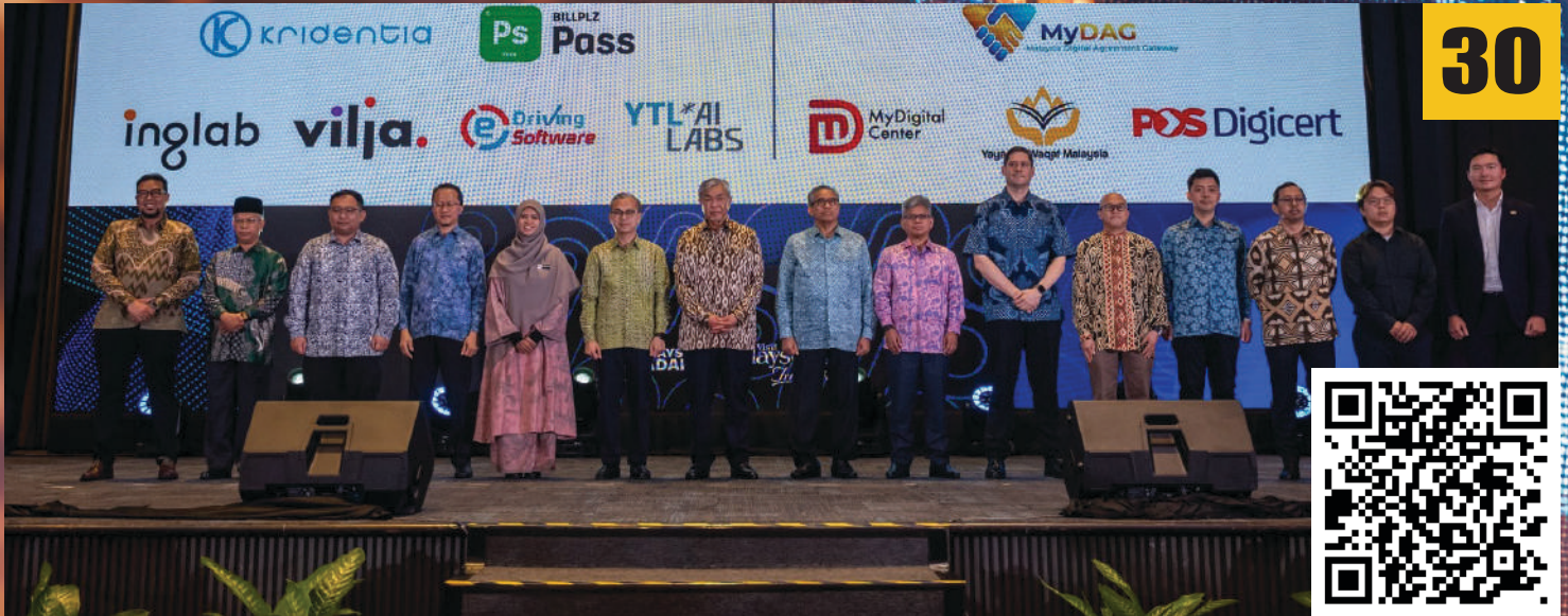
YWM Terajui Transformasi Wakaf Digital: Penyertaan Strategik MyDAG dalam konsortium MyDigital ID di Marriot Hotel, Putrajaya.