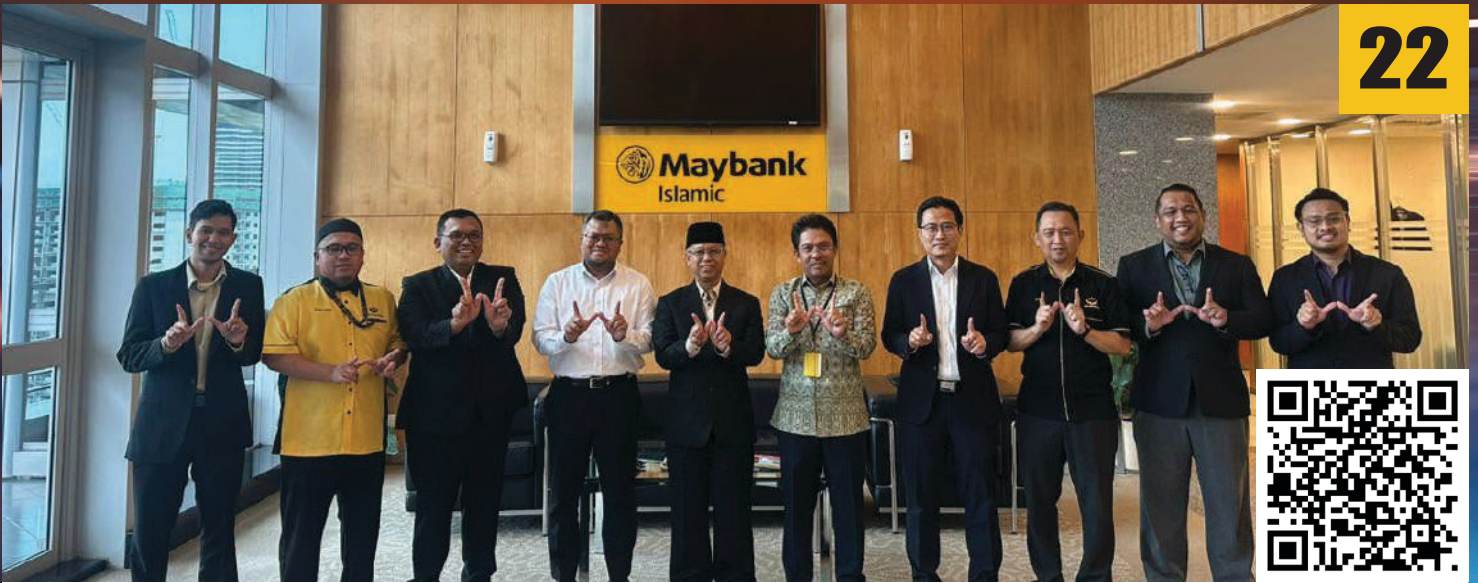
Kunjungan Hormat YWM ke Maybank Islamic Berhad di Maybank Islamic Berhad.