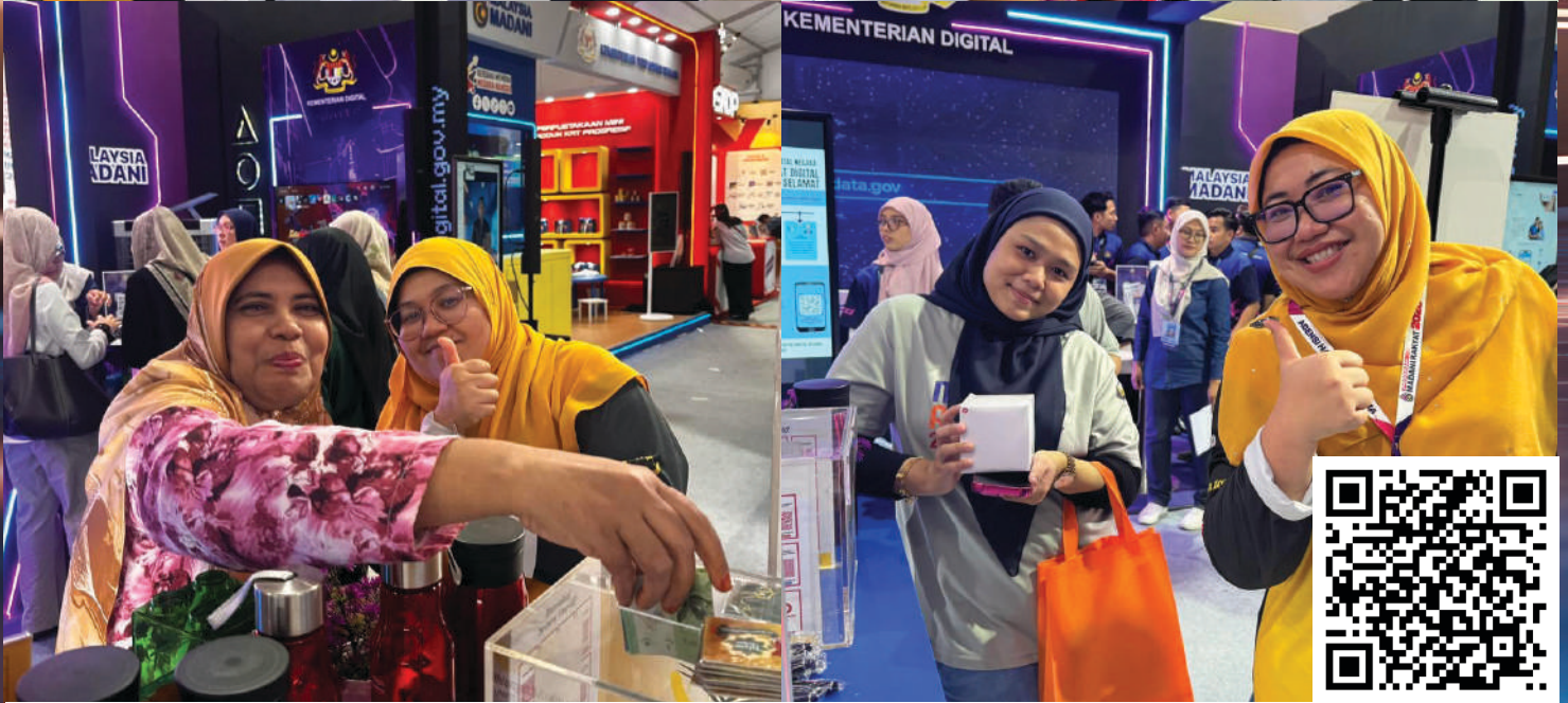
Pembukaan Kaunter Wakaf Sempena Program Madani Rakyat 2026 Perak di Bulatan Sultan Azlan Shah, Persiaran Meru, Ipoh, Perak.