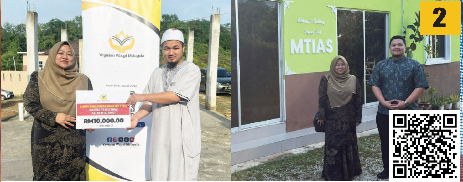
Program Ziarah Kasih Wakaf Prihatin: Sumbangan dana wakaf YWM berjumlah RM10,000 untuk Maahad Tahfiz Imam Asy-Syafie di Bangi.