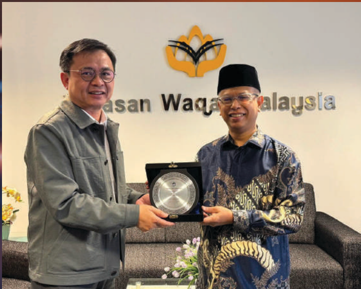
Kunjungan Hormat YWM ke Majlis Agama Islam dan Adat Melayu Terengganu (MAIDAM) di Kuala Terengganu.