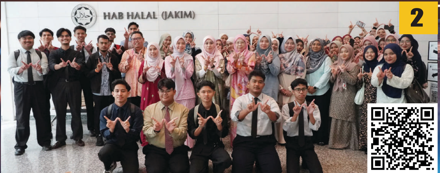
Kunjungan Akademik Politeknik Nilai ke YWM di Dewan Syura Utama Jabatan Wakaf, Zakat dan Haji (JAWHAR).