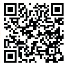
Taklimat Wakaf Sempena Majlis Pelancaran MySinarKasih Sun Life Malaysia Takaful Berhad di Petaling Jaya, Kuala Lumpur.