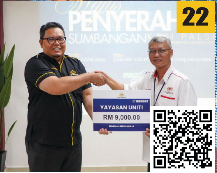
Majlis Penyerahan sumbangan Kaki Palsu "Feet4Life" di Hospital Orang Asli Gombak (HOAG).